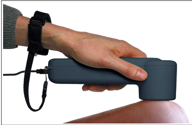
Anwendungsbeispiel des Parapulser® am Kniegelenk.